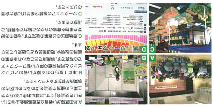
A 熟田障がい者自立支援協議会主催の「いきいき交流会」。地域にお住まいの方々の企業との連携や交流を深めるために区内の事業所が参加するイベントです。 B年に1度行われる障がい者のアピリンフェスティバル同時開催の障がい者ワークショップ C産地直送のお野菜の販売です。地物のお野菜や果物を農家の方々のご協力で多量類をご用意できます。 Dワークショップの協賛企業並びに協力企業リストです。