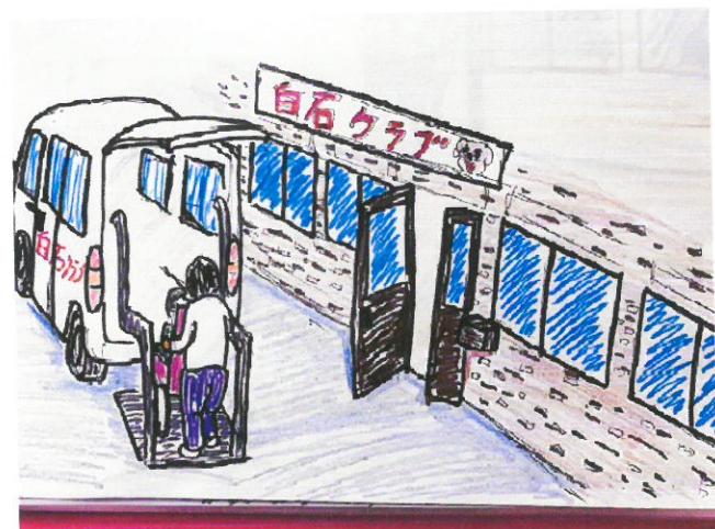
ご希望に合わせて送迎を提供いたします。